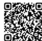
大分市ホームページ 地産地消サポーター

詳細は、右記2次元コードより 大分市ホームページをご覧ください。農政課までお問い合わせください。