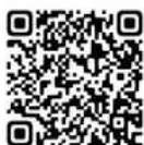
大分市ホームページ 援農かせ隊

詳細は、右記2次元コードより 大分市ホームページをご覧ください。農政課までお問い合わせください。