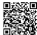
専用申込フォーム

②大分市ホームページ上の専用申し込みフォーム または右記二次元コードよりオンラインで申し込み