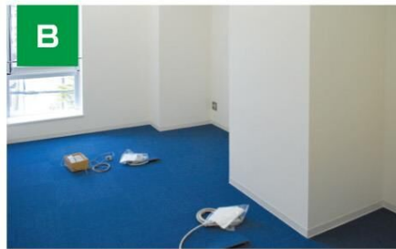
■ メイン創業支援ルーム B1～B4 4室(約14㎡)