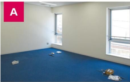
■ メイン創業支援ルーム A1～A6 6室(約28㎡)

単なる貸しオフィスではありません。インキュベーションマネージャー等による経営相談や講座の受講等ハード、ソフト両面から支援し、自立可能な状態に成長させることを目的としています。