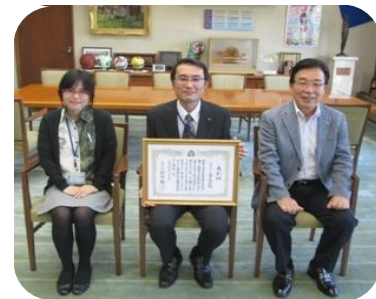
平成 25 年度に表彰された「ジェイリース株式会社」

平成 26 年度の応募の受け付けは 4 月以降を予定しています。「子育てしやすい企業」に取り組みされている事業主の皆様、ご応募お待ちしております！