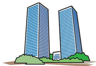
女性の活躍推進状況診断による「女性の活躍が進んでいる企業」におけるプラス効果

女性の活躍が進んでいる企業ほど、「職場が活性化」「従業員意識が向上」「業績・評価が向上」しています。