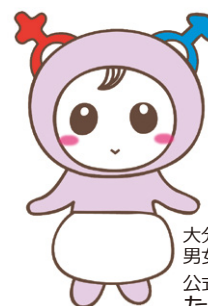
大分市 男女共同参画センター 公式キャラクター たぴよん