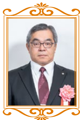
【防水施工 (防水工事業)】

1級かわらぶき技能士などの資格を有し、大分県技能顕功賞を受賞されています。また、長年にわたり大分県屋根工事業協同組合の理事長、技能検定員などを務められ、業界の発展に貢献され、現在は大分県屋根工事業協同組合の理事として、次世代のリーダー育成に尽力されています。