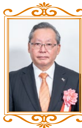
【かわらぶき (屋根工事業)】