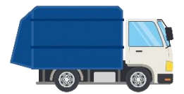
大分市の ごみ処理施設で処分

近年、テレビや新聞などで「海洋プラスチックごみ問題」が取り上げられています。プラスチックは丈夫であることから、長期間にわたって存在し、鳥や海の生物へ悪影響（ケガやプラスチックを体内に取り込むなど）を及ぼします。一人ひとりがごみを減らす取り組み（4R）を行うこと、そしてごみの適正分別・適正処理を心掛けていくことが重要です。