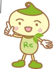
リサイクルン (大分市ごみ減量・リサイクル推進イメージキャラクター)

大分市が実施した家庭ごみ組成調査(令和元年度)の結果、燃やせるごみの中には、リサイクル可能な資源物の割合が約 15% (年間推計量13,142トン)となっています。紙類は 8% 、資源プラ(プラスチック製容器包装)が 5% 含まれていました。適正に分別をすることで、より燃やせるごみの量を少なくすることができます。1日になおすと数グラムの減量かもしれませんが、日ごろの積み重ねが大切です。皆様のご協力をお願いします。