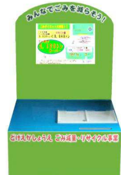
ごみ減量啓発ボード

各月の家庭ごみの排出量実績は、翌月の下旬頃に大分市のホームページや、支所・出張所に設置してある「ごみ減量啓発ボード」に掲載するほか、いろいろな場所でお知らせしています。