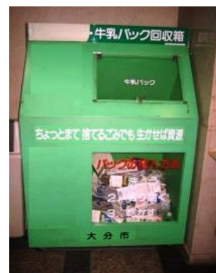
牛乳パック回収ボックス