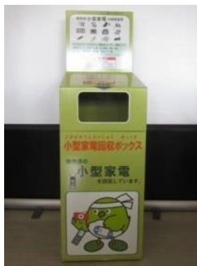
使用済み小型家電回収ボックス

市の施設23か所(本庁・支所・地区公民館・清掃事業所等)に回収ボックスを設置しています。