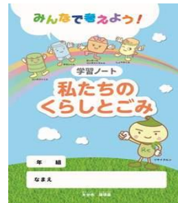
「私たちのくらしとごみ」