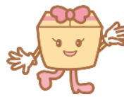
段ボール コンポストちゃん