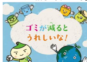
「ごみが減るとうれしいな」