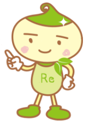
市ごみ減量・リサイクル推進イメージキャラクター リサイクルン

「古紙・布類」の日に出すことができる紙類は、「新聞類」、「本・雑誌類」、「段ボール」、「紙パック」だけではありません。 (詳しくは、ごみ分別事典をご覧ください。)