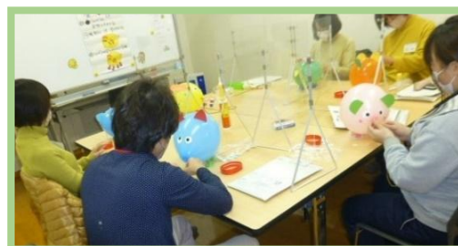
「子どもの遊び」の受講風景