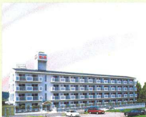
シルバーマンション虹の郷

佐野にあるシルバーマンション虹の郷は、元大学の寮を改装して高齢者の方が暮らしやすいようにしたマンションです。終日、職員さんがおり、お食事や生活のお手伝いをしてくれます。要介護の方はもちろん、要支援、自立の方まで入居可能です。随時、見学等も受け付けているとの事ですので、これからの施設探しの参考にされてはいかがでしょうか。