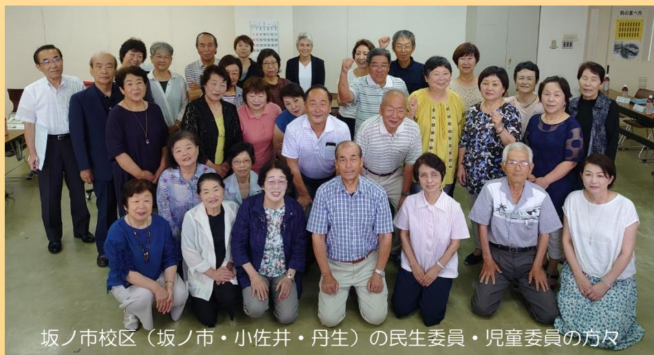
坂ノ市校区（坂ノ市・小佐井・丹生）の民生委員・児童委員の方々

みなさんのお住まいの町の高齢者や障がいのある方、子育てをしているお母さんたちの身近な相談相手として、必要な支援をおこなっているのが民生委員・児童委員さんです。私たち地域包括支援センターも民生委員さんからの相談で早期に対応できることも多く、いつも頼りにさせてもらっています。