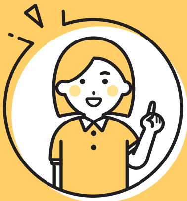
地域包括支援センター

あなたの力になってくれる人は家族以外にもたくさんいます。「困ったなあ」と感じたら気軽に相談してみましょう。