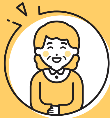
民生委員・児童委員