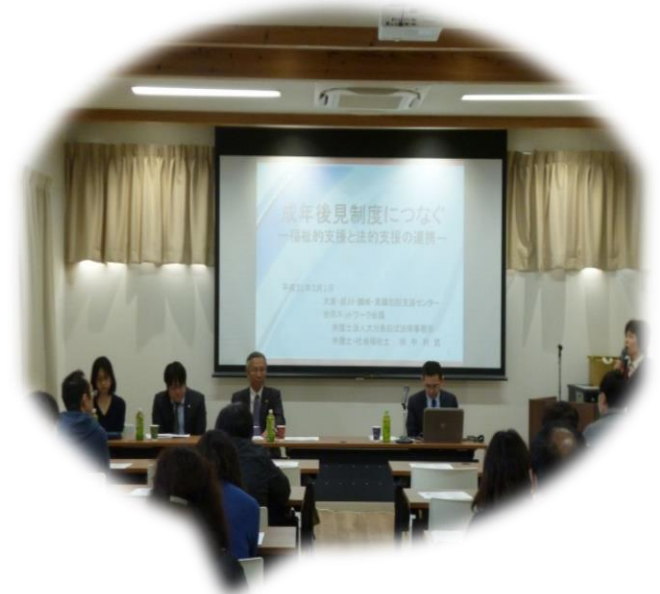
介護支援専門員研修