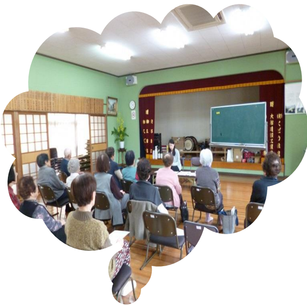
地域での健康講話