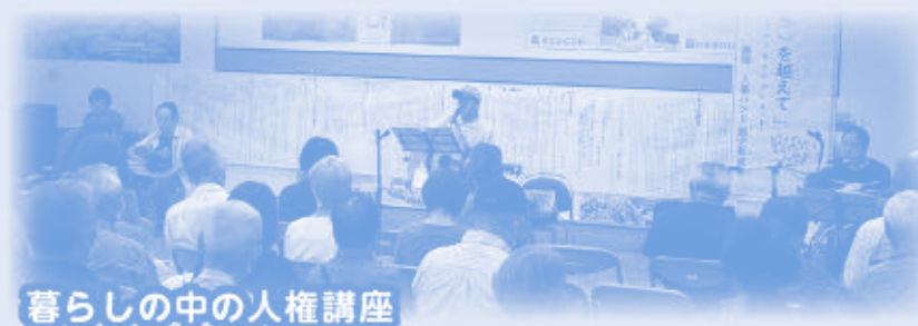
暮らしの中の人権講座

当センター利用者や地域住民に対し、直接的・間接的にあらゆる人権問題を理解してもらうため、年7回の講演会の実施や、旭町文化センターだより「あさひ」の発行等を行っています。