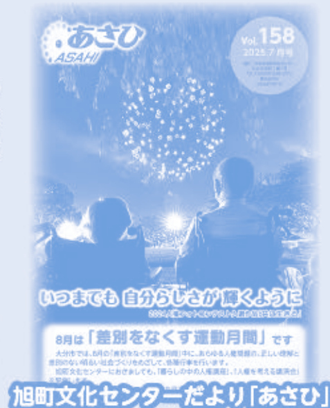
旭町文化センターだより「あさひ」