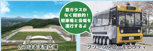
のつはる天空広場

ご来場者の駐車場は「展望広場」となります。会場の「多目的広場」へはシャトルバスをご利用いただけます。