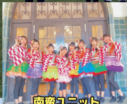
南蛮ユニット 七色こんぺいとう