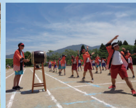
野中ソーラン (野津原中学校)