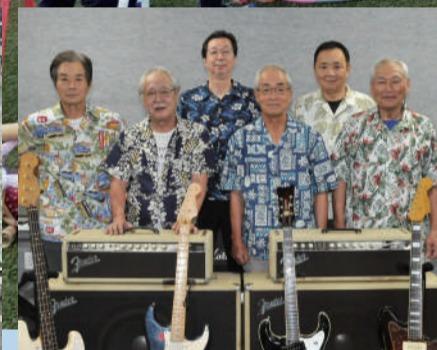
ミッドシャインズ