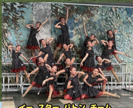
イースターバトンチーム E・STAR BATON TEAM