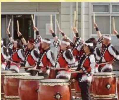
おおいた太鼓倶楽部