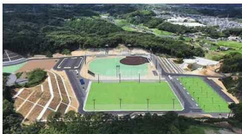
大分市南部スポーツ交流ひろば