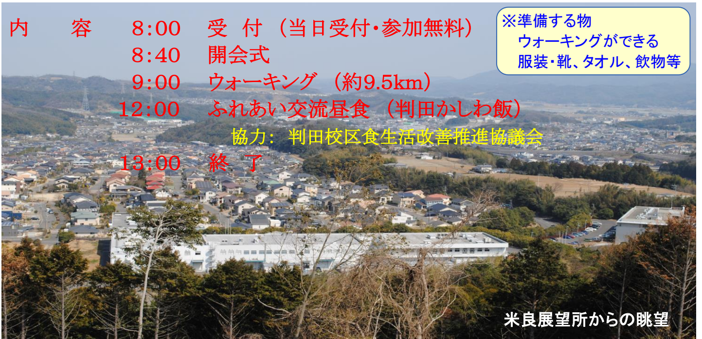
米良展望所からの眺望