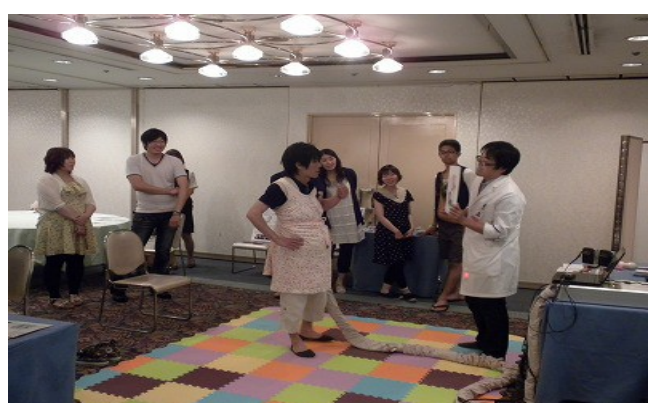
(臨月を迎えました)