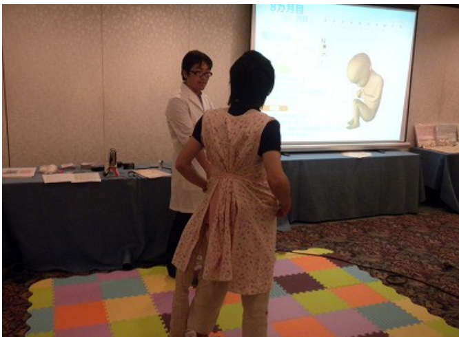
(お腹の赤ちゃんの様子がスクリーンに)