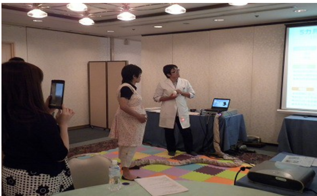
(赤ちゃんの成長によりだんだんお腹が大きくなります)