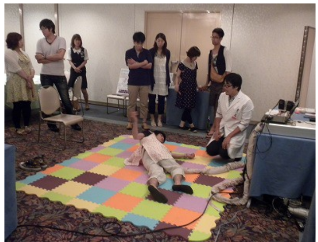
(妊婦は横になると起きるのが大変です)