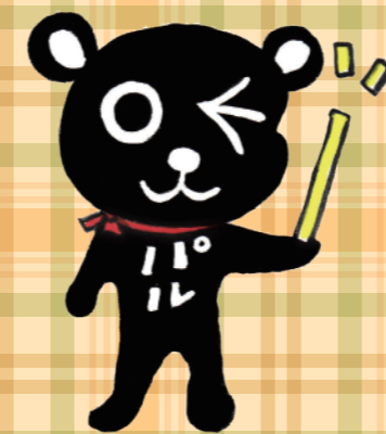
ライフパルの マスコットキャラクター 「パルクん」

多くの皆さんにNPOやボランティアの活動をより身近に感じていただき、市民活動の輪を広げ、市民主体のまちづくりを促進することを目的に第7回「おおいたNPO博」を開催します。