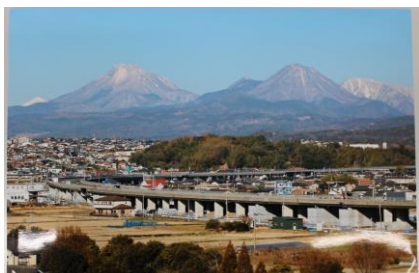
作品名：「光吉からの眺望」 作者：渡辺 節子