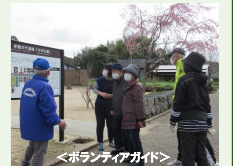
<ボランティアガイド>