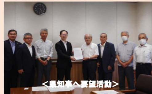
<県知事へ要望活動>