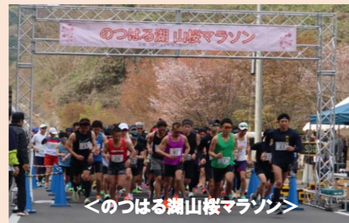
<のつはる湖山桜マラソン>