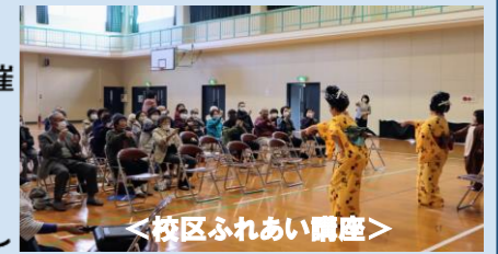
<校区ふれあい講座>