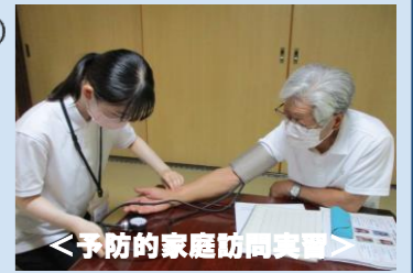
<予防的家庭訪問実習>