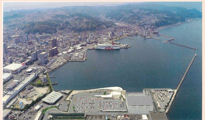
西大分側ホーバー基地完成後のイメージ図