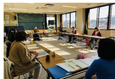
(読み聞かせボランティア養成講座)