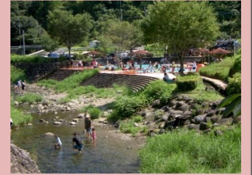
河原内河川プール