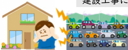
車両増加に伴う騒音