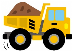
建設工事による影響