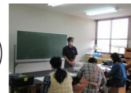
(土器ドキ陶芸ランド)