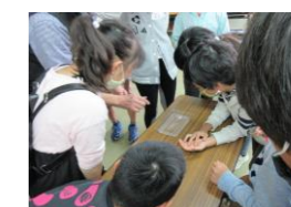
(ワクワク科学教室(高学年))