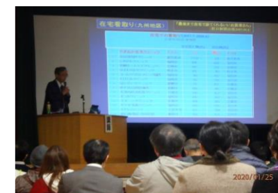
昨年の人権講演会の様子