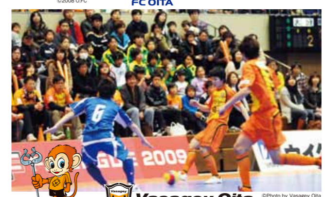
Vasagey Oita バサジ大分