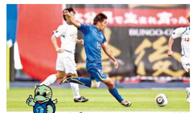
TRINITA FC OITA 大分トリニータ