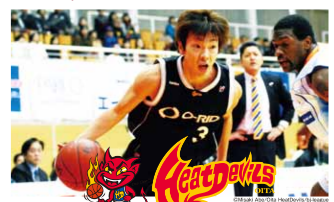
Heat Devils 大分ヒートデビルズ