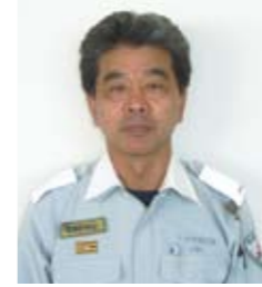
南消防署 小翠 正治消防司令補

市内の救急車の出動件数は年々急増し、平成21年は1万4,924件で、実際に救急車で搬送された人は1万3,691人でした。そのうち救急車の必要がないと思われる軽症の人が全体の約4割ほどで、その数も年々増加しています。 不必要な利用が増えると、救急車が遠方から出場することを余儀なくされ、本来必要な出場に時間がかかり、1分1秒を争う「助かる命」を救