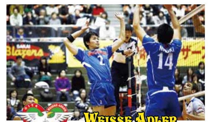
WEISSE ADLER 大分三好ヴァイセアドラー