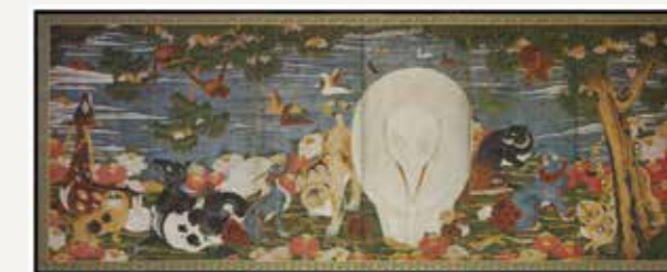
伊藤若冲「樹花鳥獣図屏風」(右隻)高精細複製画