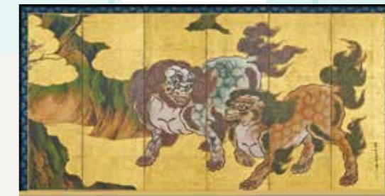
国宝 狩野永徳 「唐獅子図屏風」(右隻) 高精細複製画