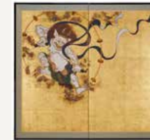
国宝 俵屋宗達「風神雷神図屏風」高精細複製画