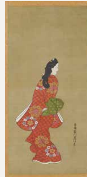
国宝 菱川師宣「見返り美人図」 高精細複製画(部分)

料金 : 一般1,000円、 高校生等500円、 中学生以下は無料 ※身体障害者手帳、療育手帳、精神障害者保健福祉手帳提示者とその介護者1人は半額(高校生等は無料)