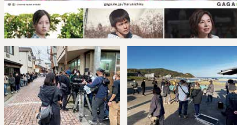
権現通り商店街(佐賀関)