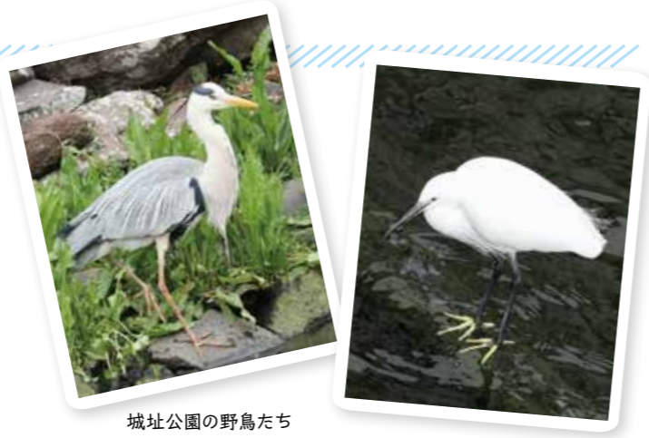
城址公園の野鳥たち

この時期は、お花見に行く人も多いと思いますが、お花見ついでに野鳥を探してみても面白いかも。