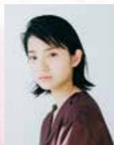
蒔田 彩珠さん (佐藤 菜)

2つの作品が面白い形で繋がっていて、物語そのものの骨格を楽しんでいただけのではないかと思いますし、映画を観ることで、自分の人生や、今までのこと、これからのことに思いを馳せて、少しでも幸せな気持ちになっていただけたらうれしいです。