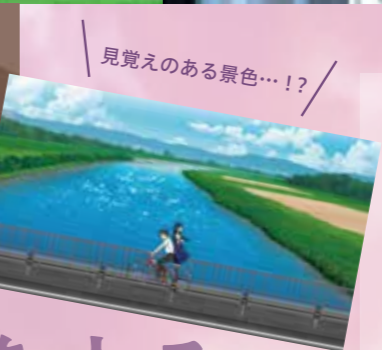
見覚えのある景色…!?

【監督 カサキ ケンイチ】 代表作:「バクマン。」「のだめカンタービレ」 選択しなかった世界を垣間見ることができる としたら、皆さんはどんな世界を覗いてみたい ですか。それよりも選んできたこの世界を間違 いにしないことを考えるべきなのかもしれませんが、 想像してみることは自由です。この世界が 豊かな想像力にあふれた世界へと向かっていま すように。