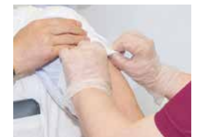
新型コロナウイルスワクチンに関する情報はこちら▶

新型コロナウイルスワクチンの2回目接種を終了した日から原則8カ月を経過した人へ順番に接種券を発送します。現在は、3年4月中旬までに2回目の接種を終了した医療従事者等の人に順次接種券を発送しています。今後の接種券発送の時期など詳しくは、市ホームページをご覧ください。※内容について変更となる可能性があります。