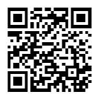
▲市公式動画チャンネルはこちら