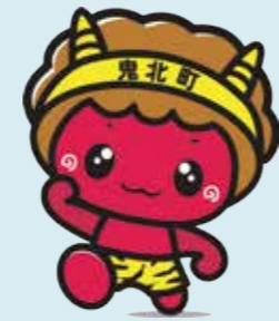
ゆるキャラ「きほくん」