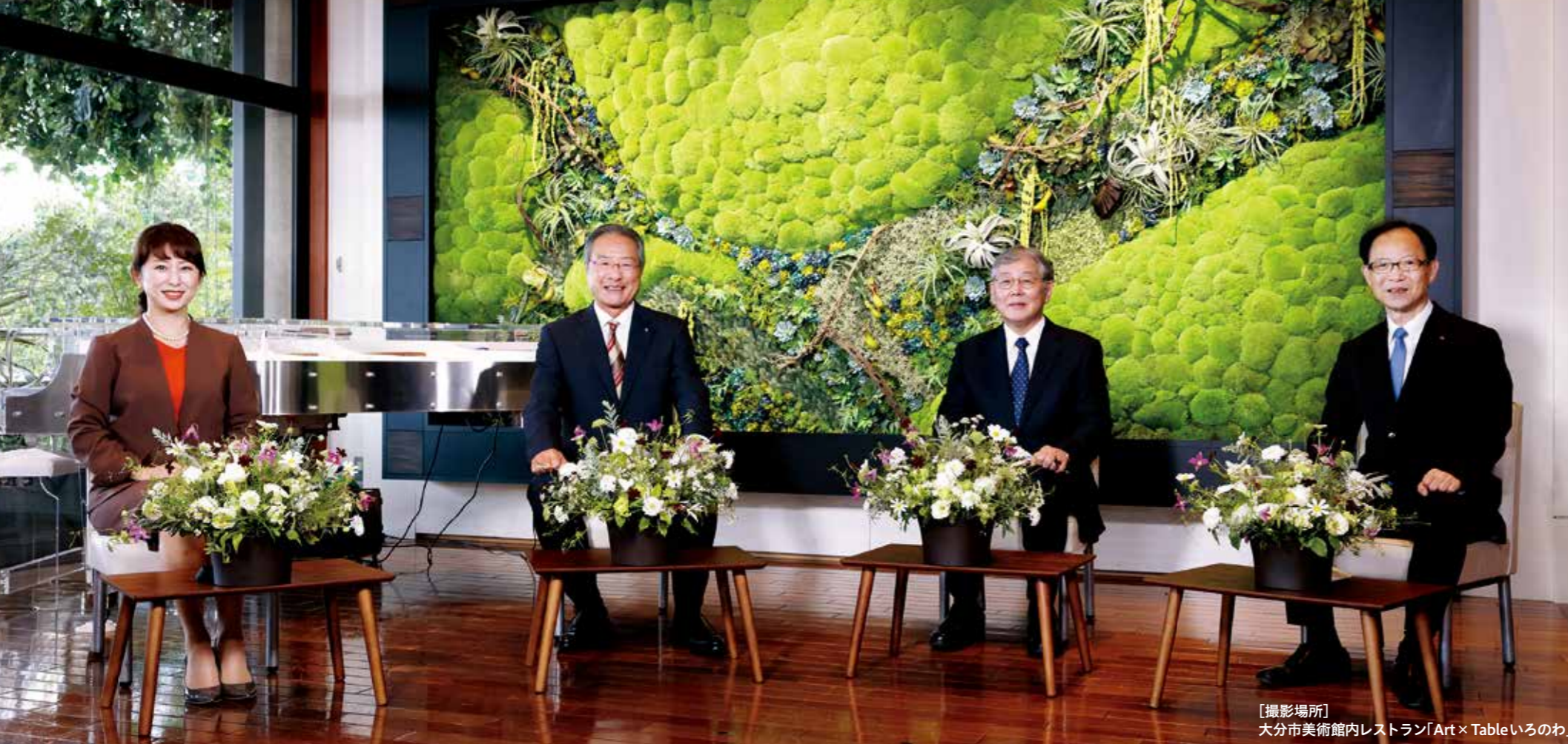
【撮影場所】大分市美術館内レストラン「Art×Tableいろのわ」

昨年私たちの生活は、新型コロナウイルス感染症により大きな影響を受けました。市における新型コロナウイルス感染症の現状を教えてください。