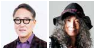
佐野 史郎氏 山本 恭司氏

九州を舞台とした小泉八雲の作品、怪談の話、おとぎ話などを、俳優 佐野史郎の朗読と、ロックギタリスト 山本恭司の演奏という斬新な組み合わせで表現します。能楽師が謡う演出もあり、能舞台の「幽玄の世界」を存分に楽しめる公演です。全席指定で、一般・小学生は5,000円(当日6,000円)、中学生以上の学生(入場時に学生証の提示必要)は500円です。小学生は保護者同伴で、未就学児は入場不可です。