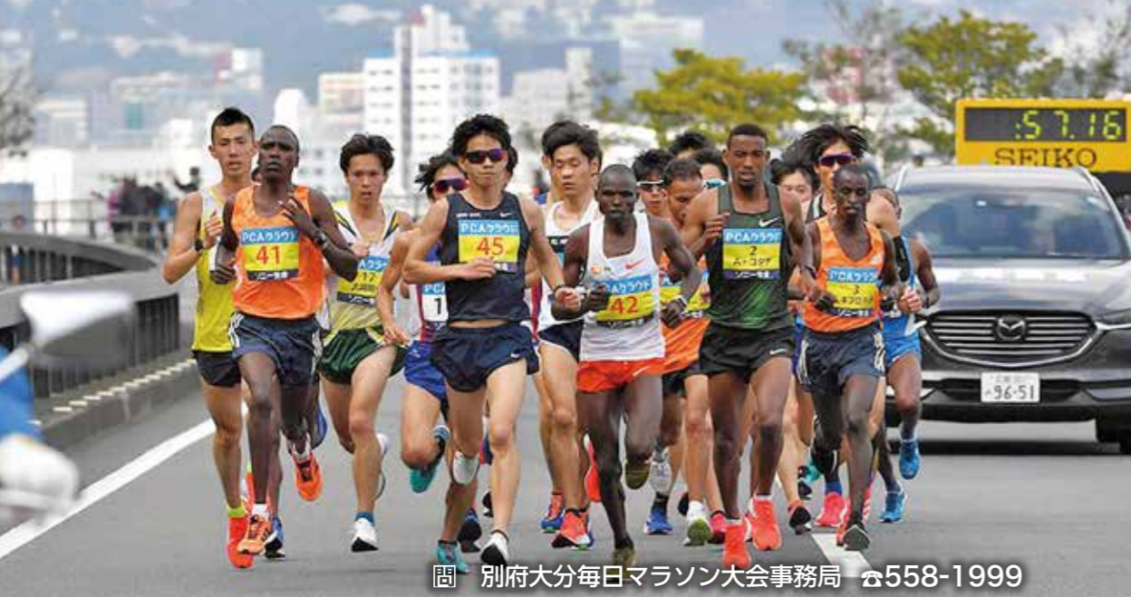
別府大分毎日マラソン大会事務局 ☎558-1999