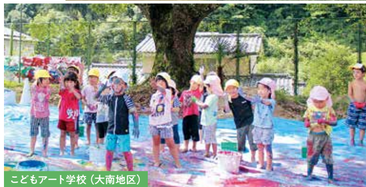
子どもアート学校 (大南地区)