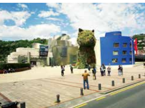
ビルバオ(スペイン) グッゲンハイム美術館

市長 カナダ東部ケベックシティの旧市街は、1985年にユネスコの世界遺産にも登録されています