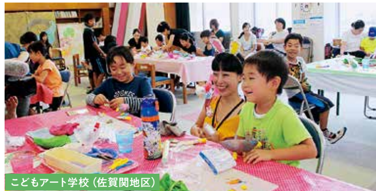
子どもアート学校 (佐賀関地区)