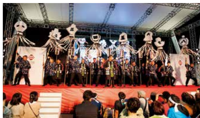
纏振り初披露の様子(祝祭の広場)

市では、地域防災のリーダーとして男性・女性の消防団員を募集しています。今回、消防団の認知度を高め、消防団員の増加など地域防災力の向上につなげることを目的に、消防団の新たな伝統作りとして「豊後八纏會」を結成しました。地域の特色を出した形状の纏（江戸時代の町火消が用いた旗印）を各方面隊に1本、計8本作成し、その纏を扱う25人を、各方面隊から選抜しました。令和2年1月12日(日)に平和市民公園で開催する新春恒例の消防出初式で纏振りを披露しますので、ぜひお越しください。また、年の瀬の火災予防のため、12月27日(金)～30日(月)に年末夜警を実施します。詳しくは、消防局総務課へ。