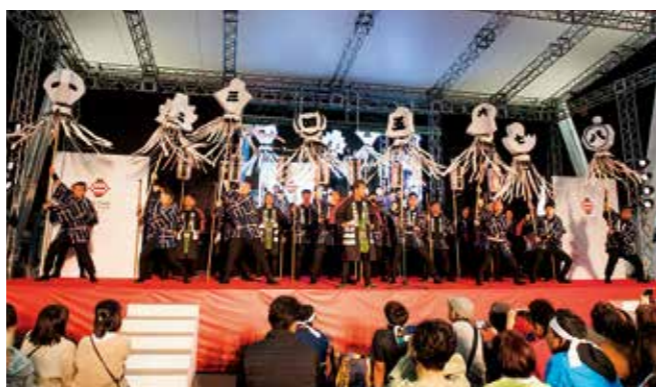
纏振り初披露の様子(祝祭の広場)

市では、地域防災のリーダーとして男性・女性の消防団員を募集しています。今回、消防団の認知度を高め、消防団員の増加など地域防災力の向上につなげることを目的に、消防団の新たな伝統作りとして「豊後八纏會」を結成しました。地域の特色を出した形状の纏（江戸時代の町火消が用いた旗印）を各方面隊に1本、計8本作成し、その纏を扱う25人を、各方面隊から選抜しました。令和2年1月12日(日)に平和市民公園で開催する新春恒例の消防出初式で纏振りを披露しますので、ぜひお越しください。また、年の瀬の火災予防のため、12月27日(金)～30日(月)に年末夜警を実施します。詳しくは、消防局総務課へ。