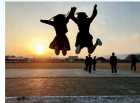
2018大分市人権フォトコンテスト入選作品「未来へ。」

確かな学びと行動により身近な一つの差別をなくすことができるのです。 部落差別解消推進法の施行から3年がたちます。 第5条には「部落差別を解消するため、必要な教育及び啓発を行うよう努めるものとする」と書かれています。そっとしておいても差別はなくなりません。