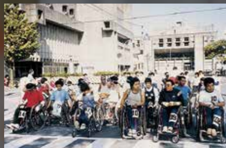
記念すべき第1回大会、スタート地点へ向かう選手たち。世界14か国117人がハーフマラソンに参加した。