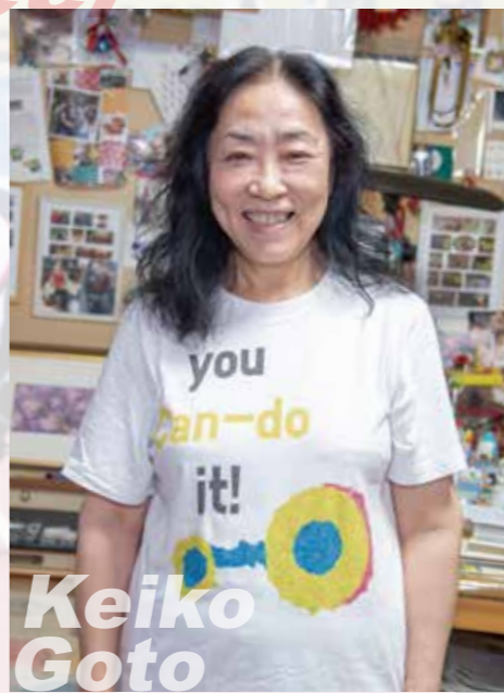
大分国際車いすマラソン通訳ボランティア「Can-do」代表

今ではレーサーという競技用の車いすを使用していますが、当時はまだ生活用の四輪の車いすで参加する人が多数いて、韓国から来た選手は病院の車いすにあぐらをかいて座り、手だけで走りゴールしました。その瞬間、すごい歓声が起こったのを思い出します。