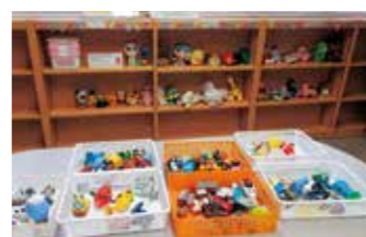
おもちゃリユースコーナー