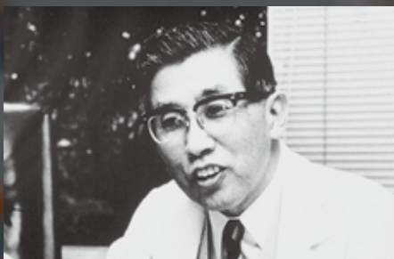
大会の生みの親である中村裕博士。「保護より働く機会を」をモットーに障がい者の自立を促すために尽力した。