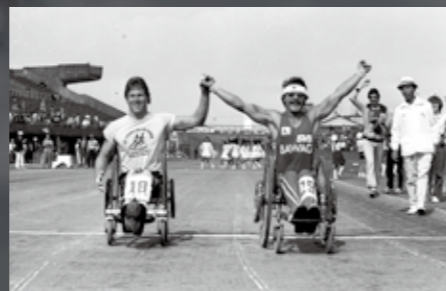
トップを走るオーストリアのゲオルグ・フロイント選手(右)と、アメリカのジム・クナウプ選手(左)が手を握りあってゴールした第1回大会のゴール地点での写真