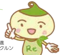
大分市ごみ減量・リサイクル推進イメージキャラクター リサイクルン