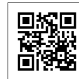
▲QRコードを読み取ると、「#おおいた元気」プロジェクト動画にアクセスできます。