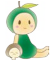
naanaマスコットキャラクター しいたん かおりん

7月7日は「大分市子育て支援サイトnaana」の日。この日にちなんで、親子参加のイベントを開催します。