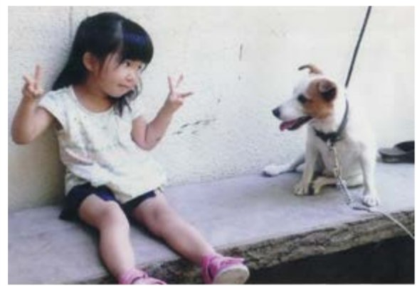
第29回 愛犬・愛猫との写真コンテスト 金賞 撮影者：瀧野 寿美子さん