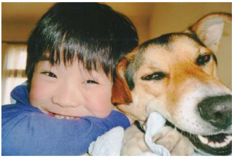
2015 人権フォトコンテスト 『仲よし兄弟』