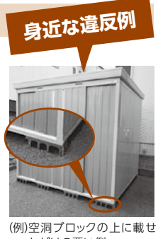
(例)空洞ブロックの上に載せただけの悪い例

建築基準法を守る必要があります。突風などによる転倒や飛散による事故を防止するため、基礎をしっかり造りましょう。場合によっては、建築確認申請や開発許可申請などが必要な場合があります。※簡易物置建築の良い例や留意事項などを記載したパンフレットが、開発建築指導課・市ホームページでご覧になれます。