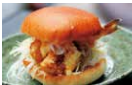
夢色大分ふぐバーガー