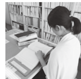
情報公開室では、市政に関する統計資料や事業概要書などの行政資料がご覧になれます。気軽にご利用ください。

※公開する場合には、公文書の閲覧か、写しの交付となります。閲覧は無料ですが、写しの交付は有料です。 ※市ホームページの電子申請システムでも公開請求することができます。