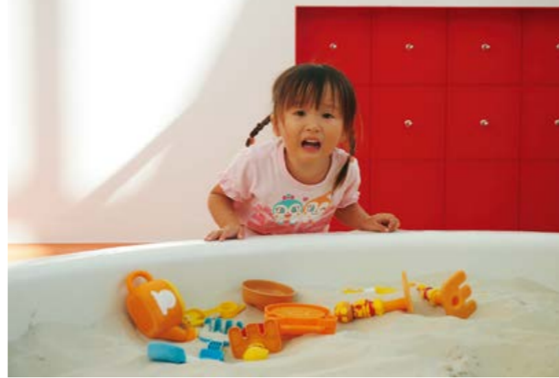
2014 人権フォトコンテスト 最優秀賞「一緒に遊ぼうよー!」