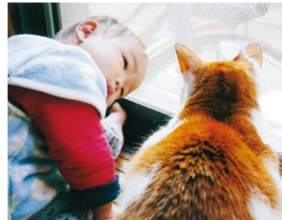
第28回 愛犬・愛猫との写真コンテスト 金賞