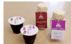
※道の駅さがのせきなどで販売しています。

【応募方法】 はがきに答え、住所、氏名、年齢、電話番号と市報の感想を記入し、12月12日(金)〈必着〉までに広聴広報課「クロスワードパズル係」(〒870-8504 荷揚町2番31号) へ。正解者の中から抽せんで3人に「おおいたの幸」ブランド化支援事業で開発された「のむヨーグルト」プレーン味・いちじく味と「水切りヨーグルト」プレーン味・いちじく味の4個セットをプレゼントします。 ※なお、当せん者の発表は商品の発送をもって代えさせていただきます。