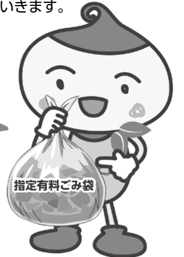
大分市ごみ減量・リサイクル推進イメージキャラクター「リサイクルン」