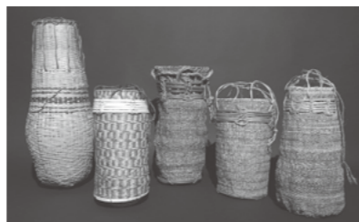
各遺跡から出土したかごの復元品

縄文と弥生時代の人々は、自然の植物を加工してさまざまな形のかごを編み、製材した木を使って優美な容器を創り出しました。これらの技術は、1万年以上もの長きにわたり伝統工芸として今日まで受け継がれています。本展示では、土の中から発見された発掘品とその復元品を展示し、発掘品本来の造形美と先人たちの卓越した技について紹介します。あわせて、市内の竹細工や竹工芸の作家の作品を展示し、その継承された匠の技を紹介します。