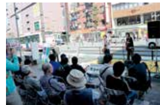
昨年のおおいた夢色音楽祭の様子

お問い合わせ おおいた夢色音楽祭実行委員会事務局(文化国際課内) ☎513-4280