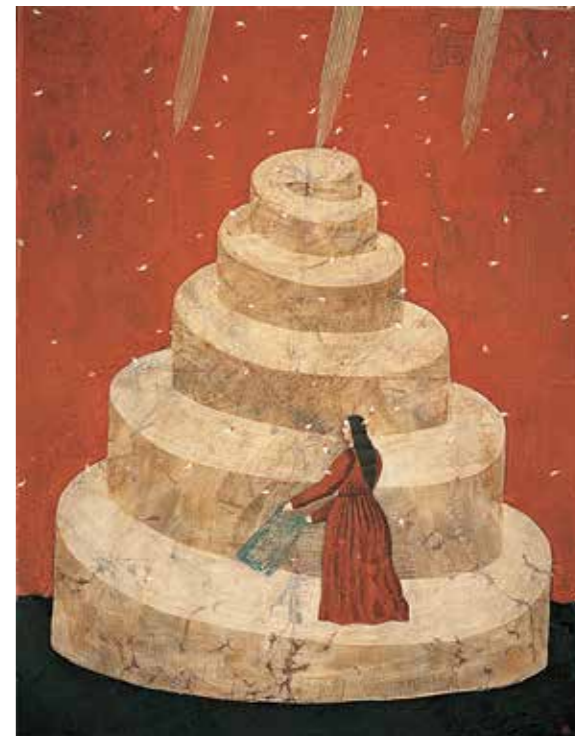
《花降る日》1977年 ©YOKO ARIMOTO

本展覧会では、大学を卒業した1973年から1984年の間の作品を中心に、絵画・彫刻・工芸作品約100点により、有元の魅力あふれる芸術世界を紹介します。